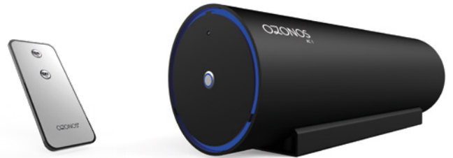
Abbildung 1: Remote Control