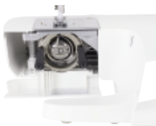
Frontal einzusetzende Spule und CB-Greifer

Stichmuster auswählen. Praktisch - einfach am Rad drehen und den Stich auswählen! 8 Grundstiche, 4-stufiges Knopfloch, Stichlänge und Breite können individuell eingestellt werden. Einfach zu transportieren mit großem Handgriff